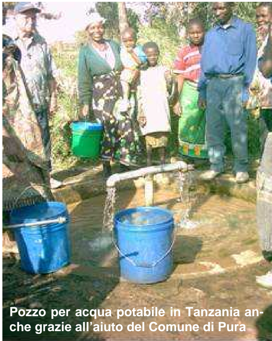
Pozzo per acqua potabile in Tanzania anche grazie all'aiuto del Comune di Pura