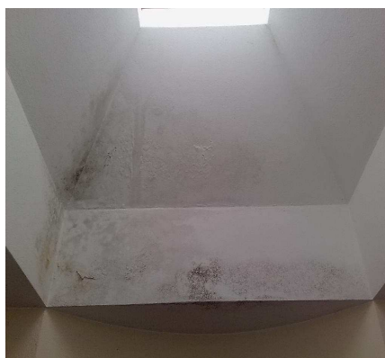
Infiltrazioni acqua dal tetto