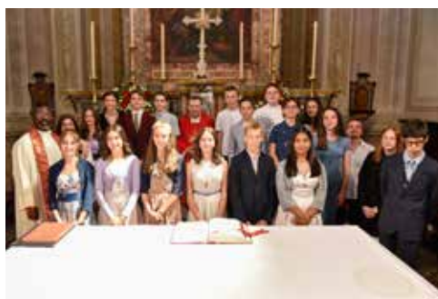
Cresima l'11 giugno