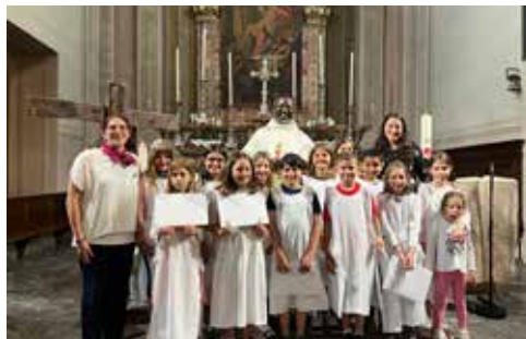
Festa del perdono dei bambini in cammino per la 1° Comunione