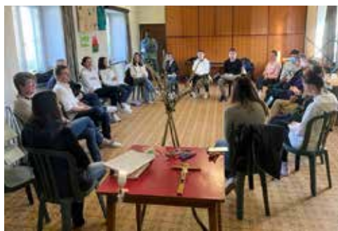
Catechesi domenicale con i cresimandi