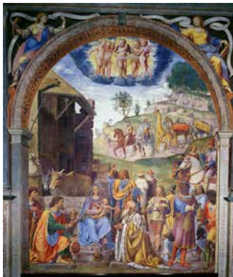
Bernardino Luini, Adorazione dei Magi, Santuario di Saronno

Natale. Guardo il presepe scolpito, dove sono i pastori appena giunti alla povera stalla di Betlemme. Anche i Re Magi nelle lunghe vesti salutano il potente Re del mondo. Pace nella finzione e nel silenzio delle figure di legno: ecco i vecchi del villaggio e la stella che risplende, e l'asinello di colore azzurro. Pace nel cuore di Cristo in eterno; ma non v'è pace nel cuore dell'uomo. Anche con Cristo e sono venti secoli il fratello si scaglia sul fratello. Ma c'è chi ascolta il pianto del bambino che morirà poi in croce fra due ladri? Salvatore Quasimodo